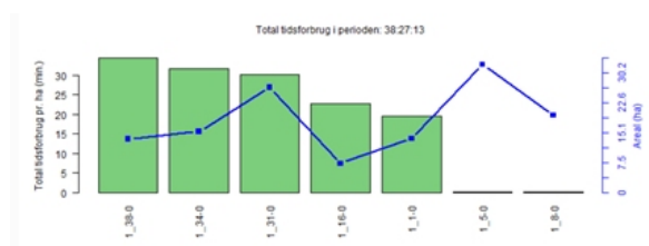
Figur 3. Markkapacitet for kartoffellægger.

Anvendelsen på alle redskaber er "den forkromede" model, som giver alle muligheder for opsyn og analyse, men som naturligvis også kræver en investering og løbende tjek af funktionaliteten.